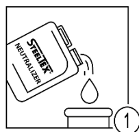
Шаг 1 - Приготовление промывочного раствора