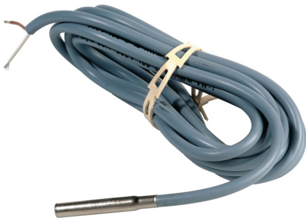
Общий вид датчика температуры типа ESMB-12

Датчик температуры типа ESMB-12 представляет собой платиновый термометр сопротивления, 1000 Ом при 0 °С), применяется для измерения температуры теплоносителя в системах отопления, Страница 2 из 6