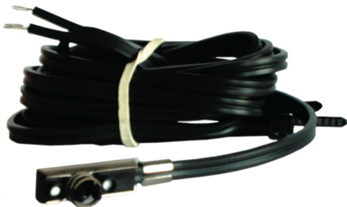
Общий вид датчика температуры типа ESMC

Датчик температуры типа ESMC представляет собой платиновый термометр сопротивления, 1000 Ом