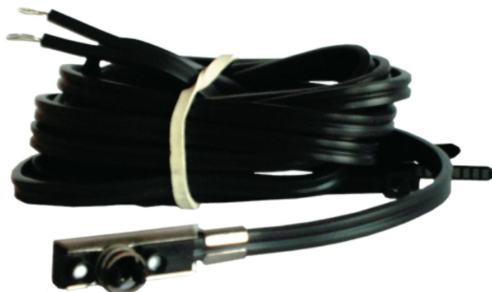
Общий вид датчика температуры типа ESMC

Датчик температуры типа ESMC, представляющий собой платиновый термометр сопротивления (1000 Ом при 0 °С), применяется для управления и индикации температуры различных поверхностей в системах отопления, охлаждения, горячего и холодного водоснабжения, вентиляции и кондиционирования.