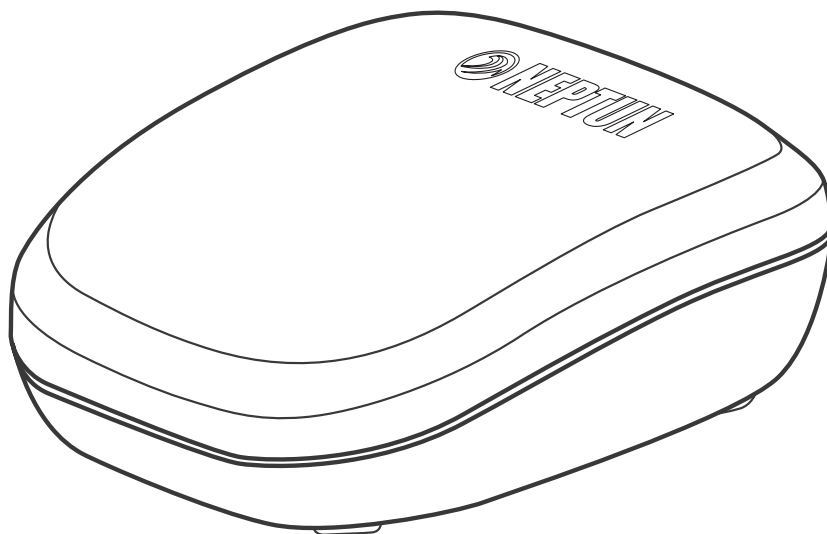
Рис. 1. Внешний вид радиодатчика